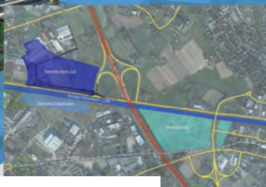
ROESELARE - IZEGEM

ER IS NOG MARGE VOOR DUURZAME PROGRESSIE OP BESTAANDE BEDRIJVENTERREINEN