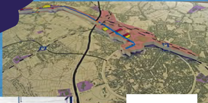
SYNERGIE LANGSHEEN HET KANAAL MOGELIJK