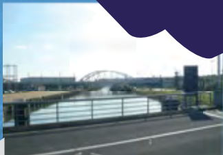
MULTIMODALE BASISINFRASTRUCTUUR AANWEZIG